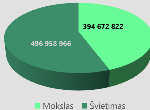
ES investicijos, skirtos švietimui, pagal sritis, Eur